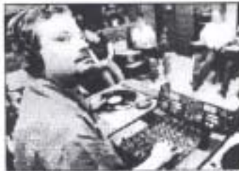
SENAC/ RJ2001 aprendem a operar a mesa de som no curso para DJ

Estudando-se em deficiência, várias instituições estão criando cursos para deficientes, principalmente na área técnica. É uma tentativa de melhorar a qualificação deles para que tenham melhores condições para ingressar no mercado de trabalho.